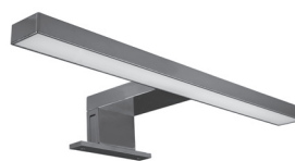
арт. 99.9822 Пластик