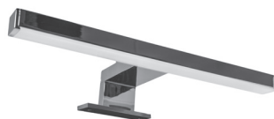
арт. 99.9821 Металл

Пожалуйста, проверяйте комплектацию при получении изделия в присутствии продавца.